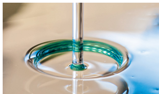
En haut : impact d'un micro jet sur une surface super hydrophobe. En bas : ressaut circulaire hydraulique d'huile silicone.

L'objectif de ce stage est d'étudier théoriquement et expérimentalement les conditions de formation d'un ressaut circulaire résultant de l'impact d'un jet submillimétrique. Il s'agira en outre de comprendre l'objet physique ainsi formé car si la gravité joue un rôle important dans la formation du ressaut circulaire classique (jets millimétriques), on peut s'attendre dans cette configuration (jets submillimétriques) à ce que la tension de surface joue un rôle prépondérant.